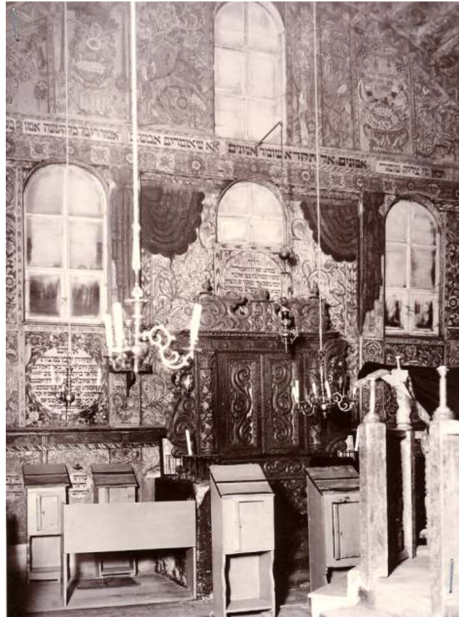
Ostwand der Synagoge, barocker Schrank, genannt "Heilige Lade", ewiges Licht;