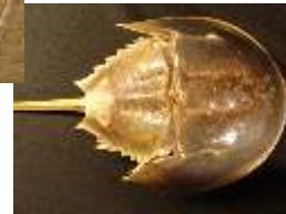
Pfeilschwanz lebt noch heute