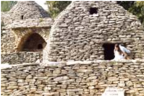
Steinhäuser in Frankreich aus dem 18. Jahrhundert