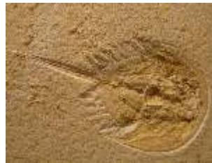
Pfeilschwanz versteinert (=Fossilien)