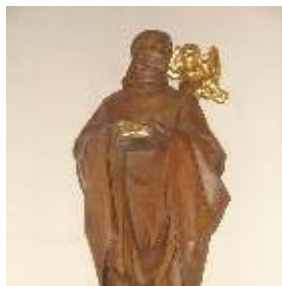
Der Evangelist Matthäus

In der Offenbarung, dem letzten Buch der Bibel, kannst du die Symbole finden: Off. 4,7 Matthäus = _____, Markus = _____, Lukas = _____ Johannes = _____.