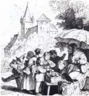
Nach der Erzählung von Jost Müller-Bohn aus dem vierbändigen Kinderandachtsbuch "...denn ihrer ist das Himmelreich" mit Bildern von Ludwig Richter, Johannis-Verlag, Lahr