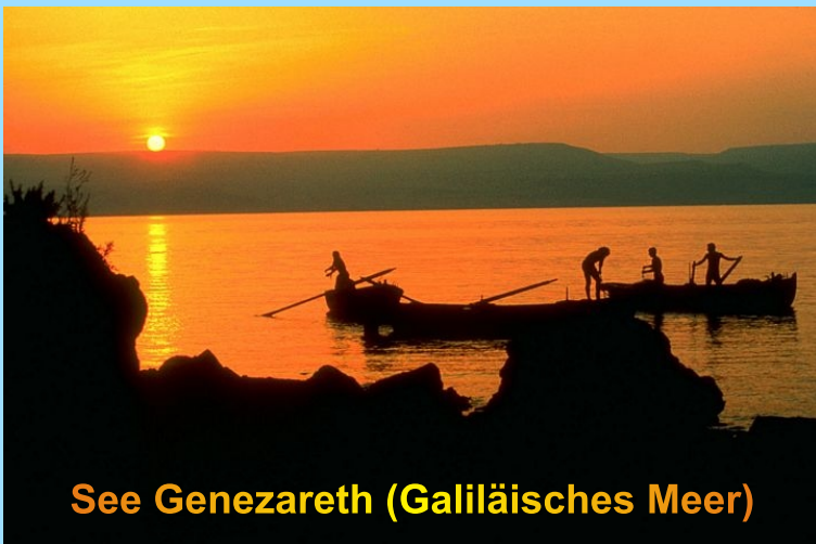
See Genezareth (Galiläisches Meer)