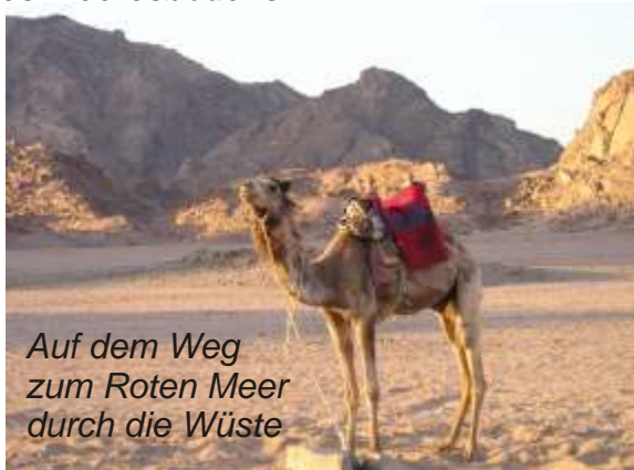
Auf dem Weg zum Roten Meer durch die Wüste