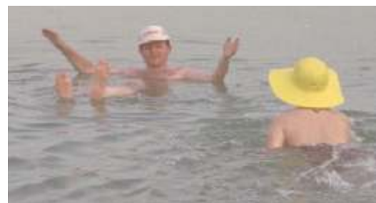
Baden im Toten Meer

Name: _____ Datum: _____ Kl. ____ Fach: _____