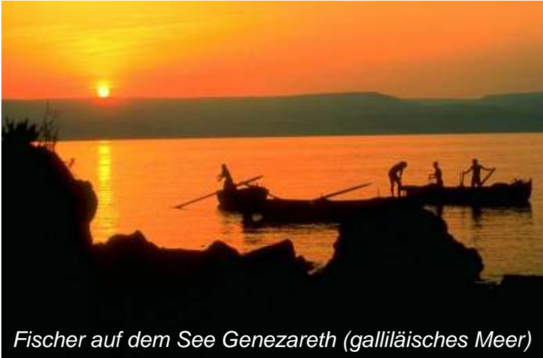
Fischer auf dem See Genezareth (galliläisches Meer)